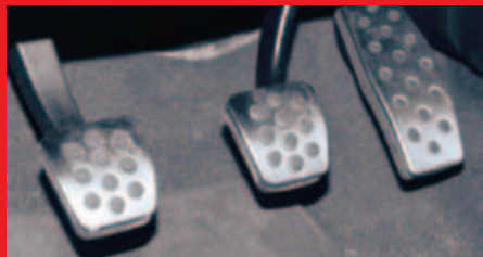
Aluminiowe nakładki na pedały to typowy dodatkowy gadżet popularny w sportowych modelach