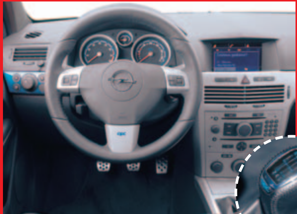
Sportowa kierownica obszyta skórą doskonale leży w dłoniach. Dyskretne oznaczenia OPC umieszczono na drążku skrzyni biegów i w kierownicy