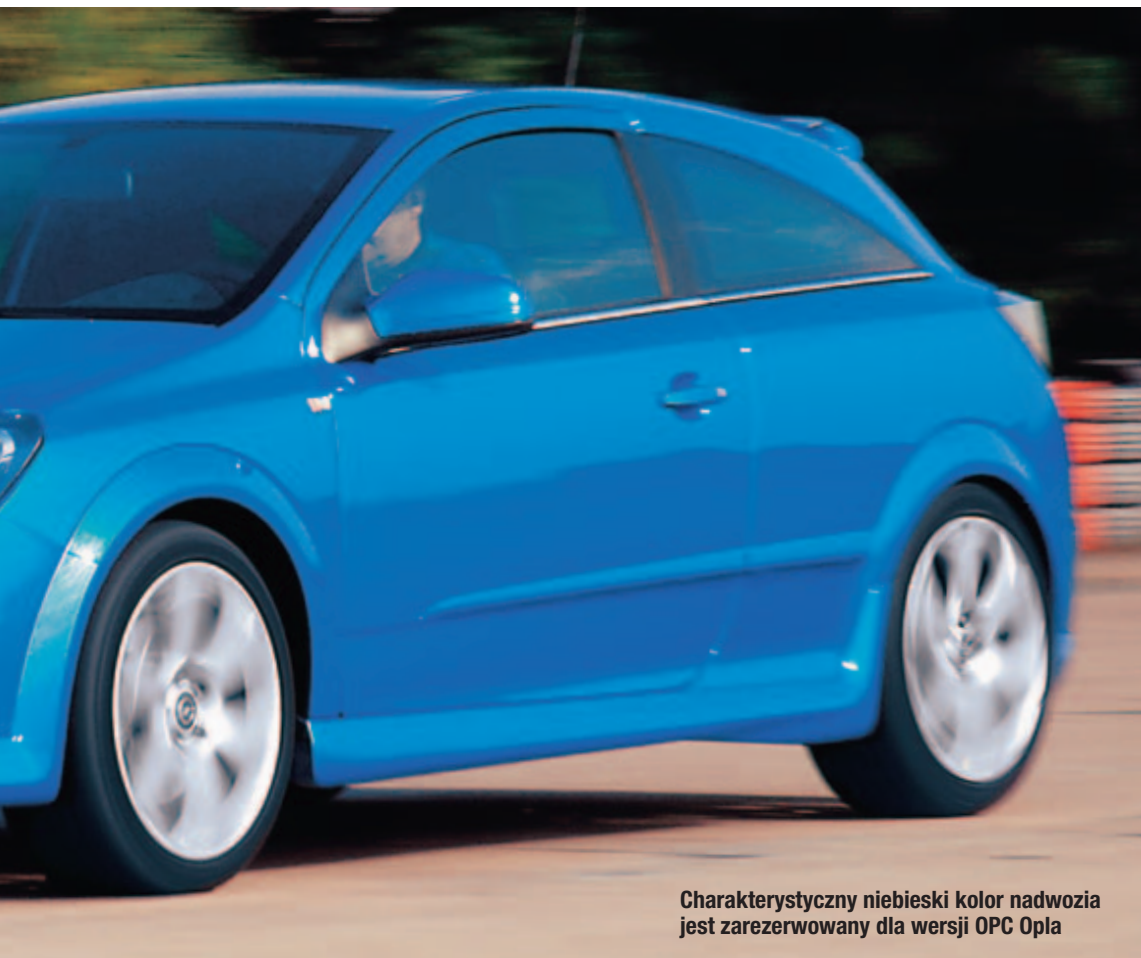
Charakterystyczny niebieski kolor nadwozia jest zarezerwowany dla wersji OPC Opla