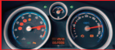
Chromowane obwódki i charakterystyczne niebieskie wstawki to cechy rozpoznawcze OPC