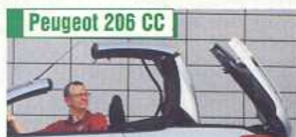
Peugeot 206 CC

Roadster Opla wygląda nowocześnie. Poczynając od kanciastego „nosa”, a na potężnym tył kończąc – tak odważnego Opla nie widzieliśmy już dawno. Nie wspominając o tym, że auto aż emanuje pewnością siebie.